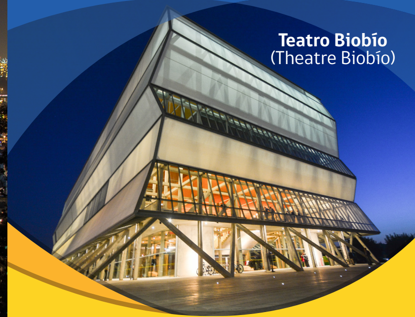
Teatro Biobío (Theatre Biobío)